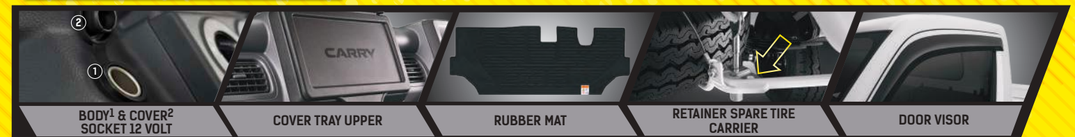
BODY 1 & COVER 2 SOCKET 12 VOLT